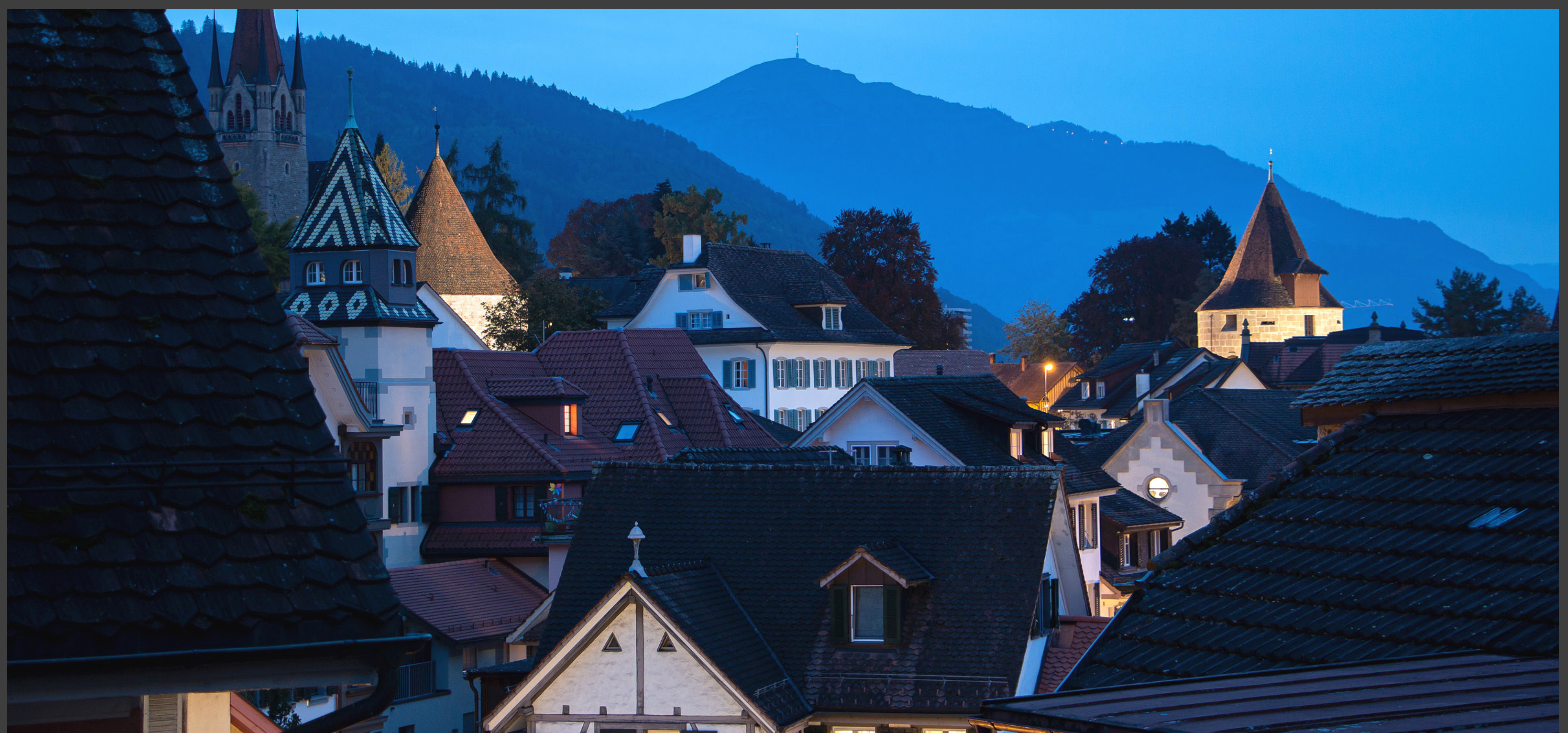
Der Huwilerturm links und der Pulverturm rechts