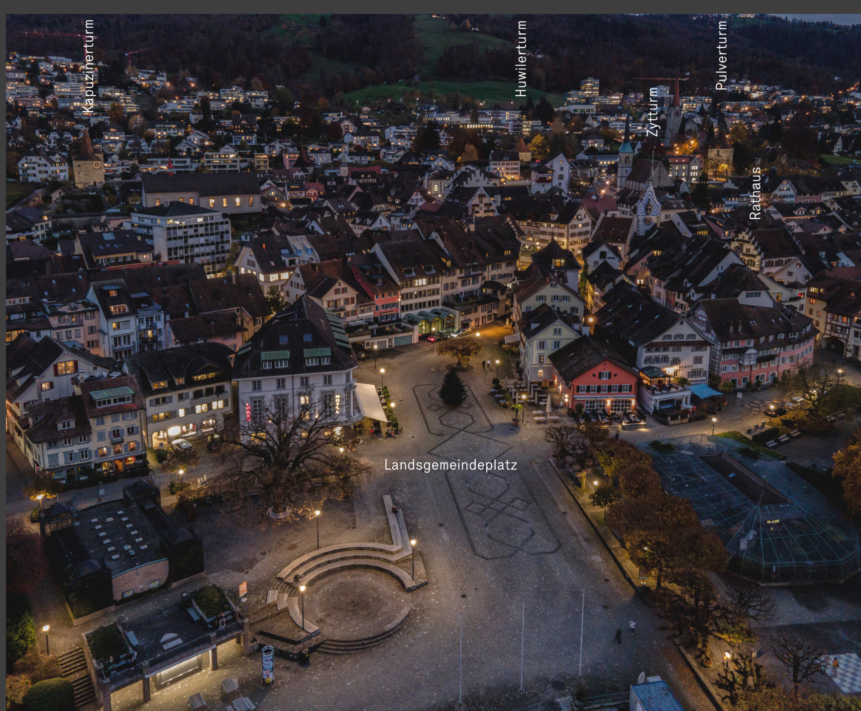
Beleuchtungen im Zentrum von Zug

Die beleuchteten Bauwerke fügen sich sehr dezenter in das nächtliche Erscheinungsbild der Stadt. So stand die Nahwirkung im Vordergrund. Mit dem Projekt ging auch eine Reduktion der Betriebszeiten einher.