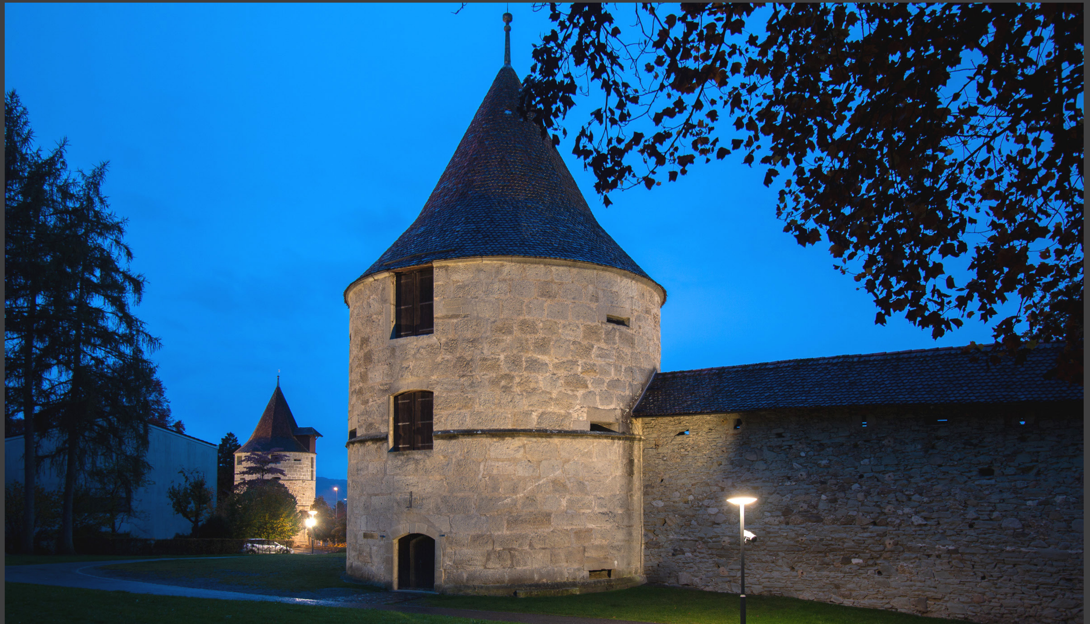
Der Huwilerturm und im Hintergrund der Pulverturm