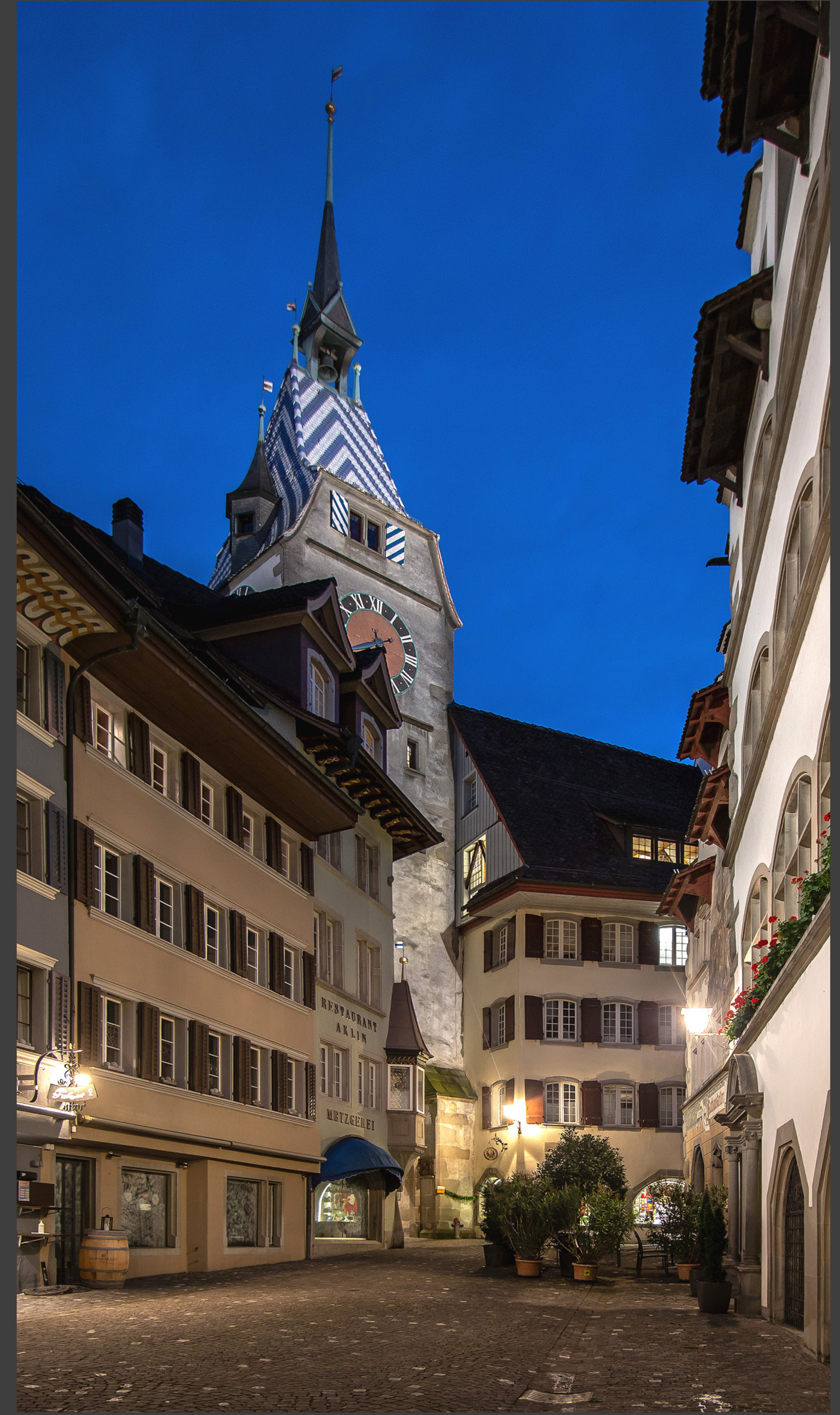
Zytturm von der Altstadtseite und rechts das ebenfalls beleuchtete Rathaus